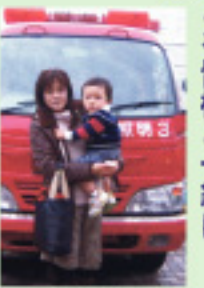
フェスタ鶴川子ども祭り

子育てのお陰で、さまざまな事が生活実感として考えられるようになりました。暮らしの事や地域のことを皆様と一緒に、一つ一つ問題解決していきます。