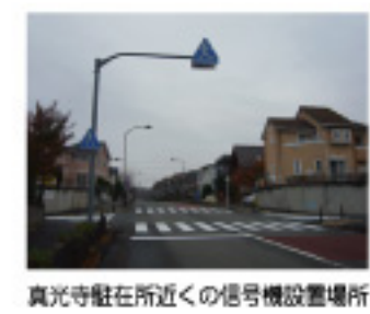
真光寺駐在所近くの信号機設置場所