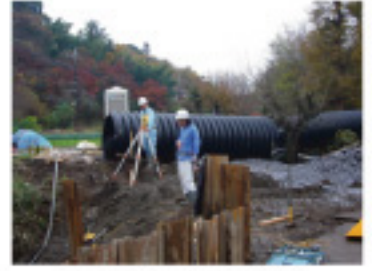
三輪地域の河川改修現場

10月1日から路上喫煙禁止条例が施行されました。公共の場所では指定された場所以外での喫煙が禁止されました。