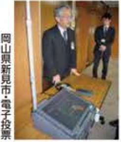
岡山県新見市電子投票

質問 子育て支援センターは、子育て支援の充実を。子育て支援センターは、子育て支援の充実を。 (答) 子育て支援センターは、子育て支援の充実を。