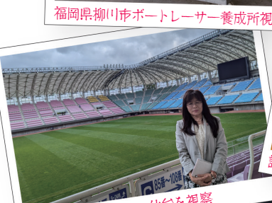
ユアテックスタジアム仙台を視察