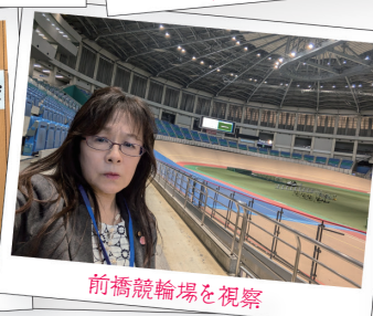
前橋競輪場を視察