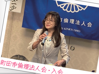
町田市倫理法人会・入会