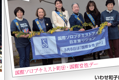
国際ソロプチミスト町田・国際女性デー