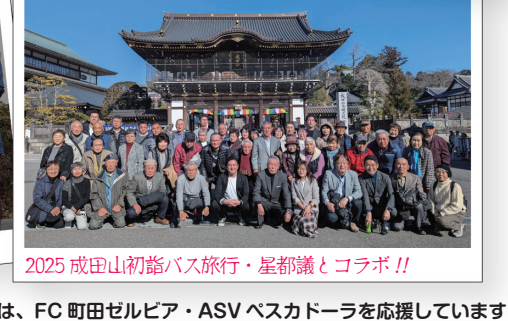
2025 成田山初詣バス旅行・星都議とコラボ!!