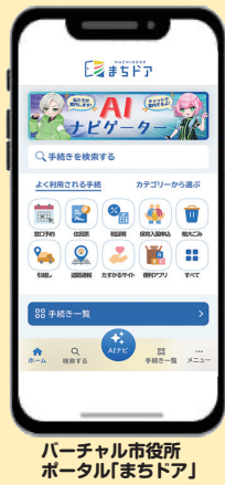
バーチャル市役所 ポータル「まちだア」

2025 年 5 月から戸籍に氏名の振り仮名が記載されることに伴い、町田市に本籍がある方に対し、戸籍に記載する予定の振り仮名を通知し、届出の受付等を行う。