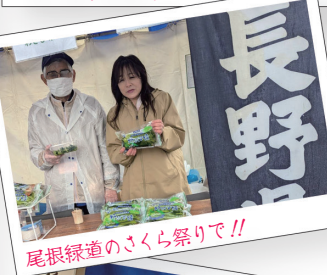
尾根緑道のさくら祭り!!