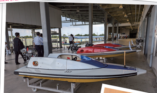
福岡県柳川市ポートレーサー養成所視察