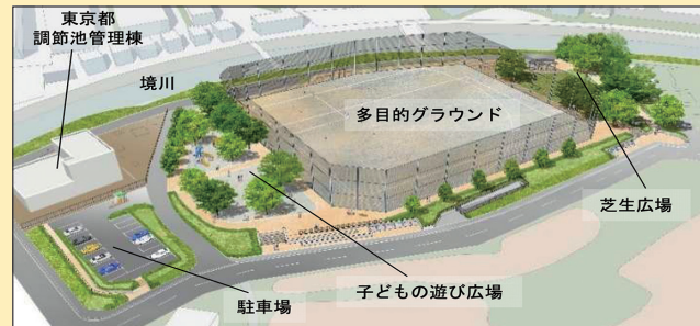
(仮称) 境川金森調節池上部公園イメージ図