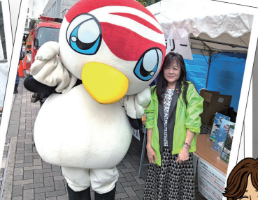
鶴川商店会のツルちゃんと