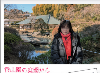
香山園の庭園から