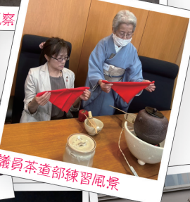
議員茶道部練習風景