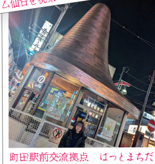
町田駅前交流拠点 はっとまちだ