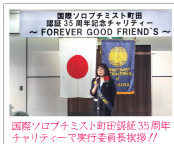
国際ソロプチミスト町田 認証35周年記念チャリティー ~FOREVER GOOD FRIEND'S~ 国際ソロプチミスト町田認証35周年チャリティーで実行委員長挨拶!!

昨年も色々なところへ出掛け、気づきや学びや貴重なご意見をいただきました。心に残ったほんの一部をご紹介します。皆様の暮らしや市政に役立つように、今年も様々なところへ出掛け、様々な方達と交流し学んでいます。