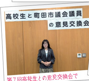
第7回高校生との意見交換会で