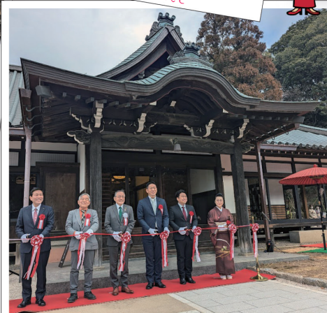
香山園開園式 鶴川香山園(かごやまえん)が、2025年1月25日(土)に開園しました。池泉回遊式庭園と書院造の建物を持つ緑豊かな和の空間を楽しめる施設です。市は鶴川駅周辺市街地に残された貴重な緑の保全と都市景観の向上を図るとともに、市の観光拠点の一つとするため、美しい庭園と書院造の建物を都市公園としてリニューアルしました。建物には、レストランや物販スペースを設けています。